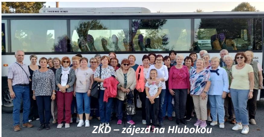
ZKD – zájezd na Hlubokou