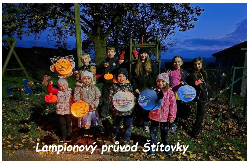
Lampionový průvod Štítovky