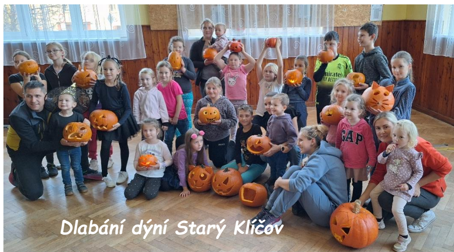
Dlabání dýní Starý Klíčův