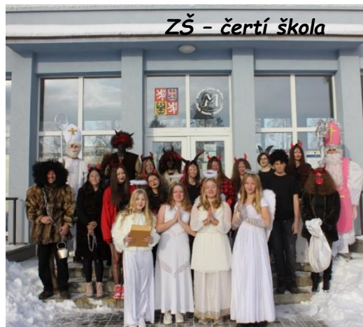
ZŠ - čertí škola