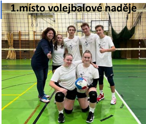
1.místo volejbalové naděje